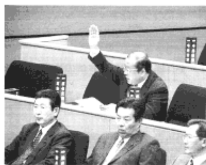
◆2月定例議会・議案質疑 (3月8日)