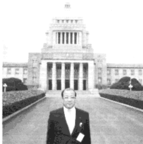
◆国会を視察 (3月30・31日)