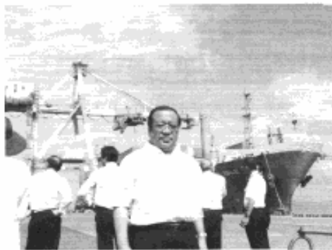
◆名古屋港管理組合議会行政視察