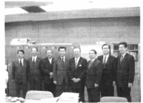
◆神田知事があいさつ (10月12日)

神田知事が9月議会の御礼と改めての知事選への決意を公明党控室で述べられ、一緒に勝利を誓い合った写真です