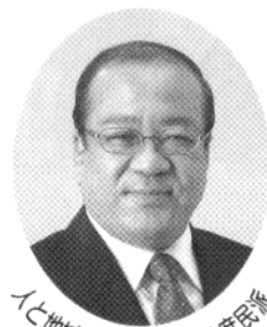
人と地域と政治をつなぐ! 庶民派